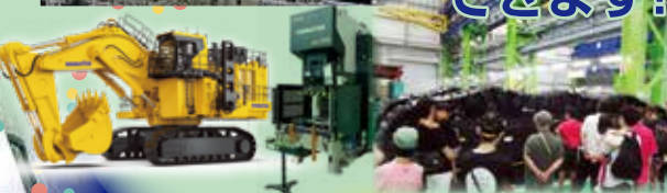
※写真はイメージです。実際とは異なります。