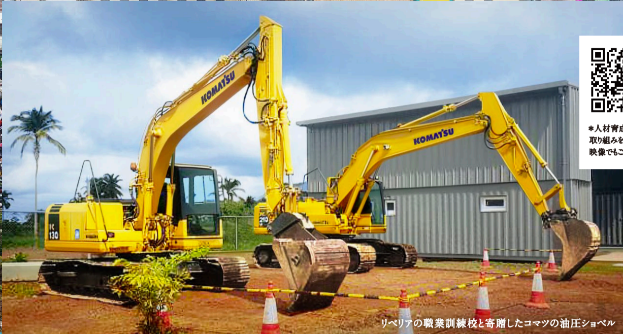
リベリアの職業訓練校と寄贈したコマツの油圧ショベル