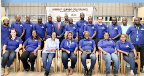
職業訓練校スタッフ

内戦が終結し、再建に取り組む西アフリカ・リベリアで、日本政府が出資、国際連合工業開発機構が運営に携わる職業訓練校。復興で都市開発が進むなか、建機のオペレーターやメンテナンスなどの技能者を育成するため、コマツの知見が求められた。基礎知識と技術を3カ月で学ぶカリキュラムをつくり、機械や設備も提供。2014年から約5年間で300人以上の若者が卒業し、地元企業などに巣立っていった。プロジェクトはその後、独り立ちし、現在も地域を支える人材を生み出している。