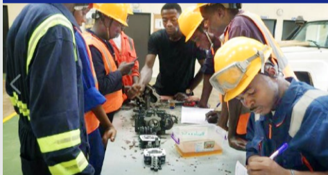
油圧、電子機器・トレーニングコースの 実習風景