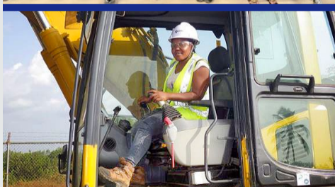
卒業後 インストラクターとして活躍する女性