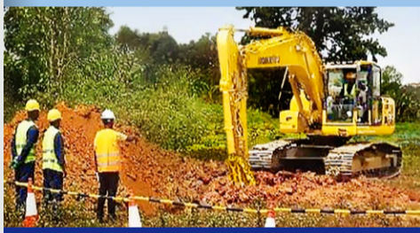
オペレーター・トレーニングコースの 実地訓練

建設機械のオペレーションから、子ども向け出前授業まで、コマツが手がける人材教育は全方位的だ。1917年、前身となる小松鉄工所の立ち上げとほぼ同時に、機械を動かす技術者の養成所を設立。教育の内容は、海外展開に伴い現地の実情に合わせておのずと多彩になっていった。そんなコマツに、一つのプロジェクトへ協力の相談が舞い込む。